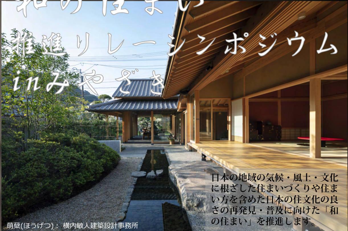
萌葉(ほうげつ)：横内敏人建築設計事務所

日本の地域の気候・風土・文化に根ざした住まいづくりや住まい方を含めた日本の住文化の良さの再発見・普及に向けた「和の住まい」を推進します。